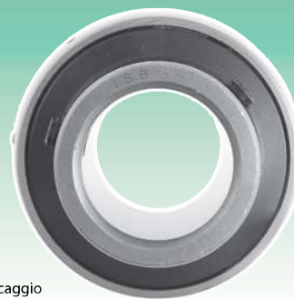
Suffisso UNF: Misure in pollici dei grani di bloccaggio UNF suffix: inch sizes set screws